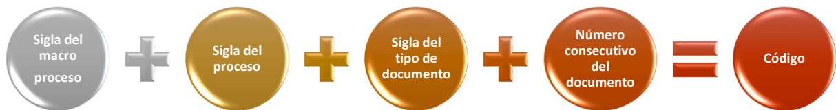
Gráfico. Codificación de documentos