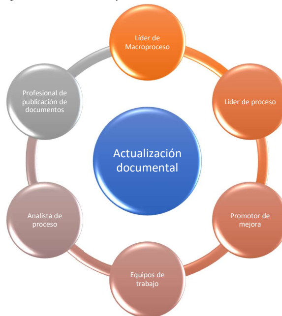
Gráfico. Actores para la elaboración y control de documentos del Sistema de Gestión