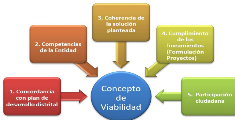
Ilustración 1 – Criterios para emitir concepto de viabilidad

Según el ABC de la viabilidad (DNP, 2018), la viabilidad de un proyecto de inversión es un proceso integral de análisis de la información que busca determinar si el proyecto cumple con los criterios metodológicos de formulación y los aspectos técnicos de su estructuración, si está articulado con los desafíos del desarrollo plasmados en planes y políticas públicas del territorio, si es sostenible en el tiempo y si es rentable económicamente. La expedición de un concepto de viabilidad de un proyecto se refiere a la verificación de los siguientes aspectos: i) la concordancia del proyecto con los lineamientos y políticas del plan de desarrollo distrital, ii) las competencias de la entidad para ejecutar el proyecto propuesto, iii) la coherencia de la solución que plantea el proyecto con el problema o situación que se pretende resolver, y iv) el cumplimiento de los lineamientos para la formulación de proyectos, establecidos en el Manual de Procedimientos en la parte correspondiente a la elaboración del documento "Formulación y Evaluación del Proyecto".