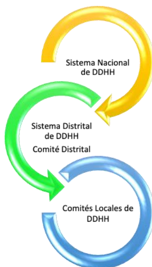
Gráfico 3. Interacción del Sistema Distrital de Derechos Humanos