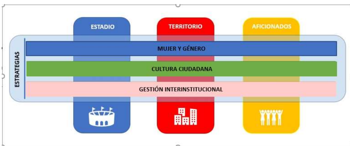
Ilustración 2. Componentes del programa

Los componentes de desarrollo son espacios en los que se lleva a cabo cada acción, y están denominados como estadios y territorio (localidades urbanas), y aficionados, como la población objetivo del programa.