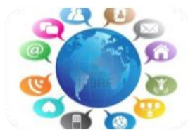
2.1.5 DEFINIR CANALES DE COMUNICACIÓN