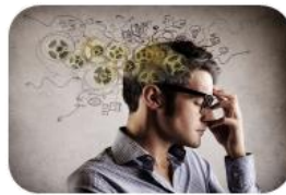
2.1.2 GENERA ESTRATEGIA