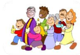
2.1.3 IDENTIFICA GRUPOS CIUDADANOS