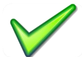
2.1.9 CERTIFICACIÓN MINTIC

Ilustración 1. Etapas para certificación nivel 1 sello de excelencia gobierno abierto - participación ciudadana por medios electrónicos.