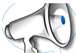
2.1.6 GENERAR LA CONVOCATORIA