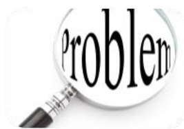
2.1.1 IDENTIFICA PROBLEMÁTICA