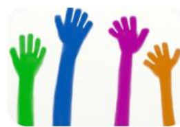
2.1.7 REALIZACIÓN EJERCICIO PARTICIPACIÓN CIUDADANA