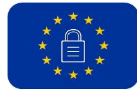
2.1.4 POLÍTICA PROTECCIÓN DATOS