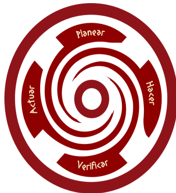
Figura inspirada en un volante de huso o tortero Muisca, utilizado para hilar fibras. Representa los factores de unidad y articulación de nuestros procesos, en los cuales la Caracterización es el hilo conductor.